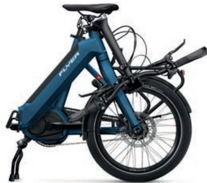
Upstreet2 5.00 Folded: 93 x 85 x 40 cm

Egal ob beim Camping oder beim täglichen Pendeln mit der Bahn – wenn es richtig eng hergeht, spielt das Upstreet2 seine wahre Grösse aus. Nicht klein beigeben muss das kompakte Faltrad bei den Fahreigenschaften: Dank cleverem faltgelenk mit doppelter Sicherung und dem stabilen Rahmen überzeugt das Upstreet2 mit erstaunlicher Fahrstabilität und Komfort. Die agilen 20 Zoll Laufräder und der harmonische Bosch Antrieb sorgen für ein dynamisches Fahrvergnügen. Dabei folgt das Upstreet2 dem Motto «Eines für Alle» – denn dieses One-Size E-Bike passt für alle Personen, egal ob sie 150 oder 190 Zentimeter gross sind. Wahrhaft mannigfaltig sind die Gelegenheiten, in denen das kleine Upstreet2 ein grosses Extra an Freiheit bedeutet.